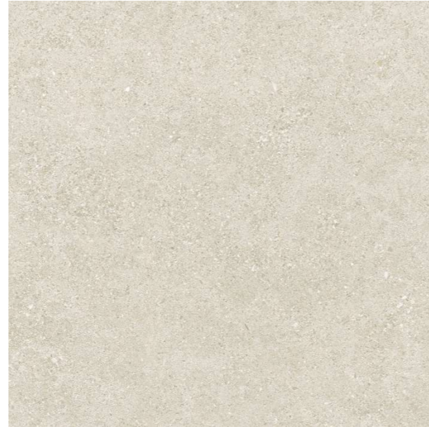
Roadstone Linen 90x90 cm

Solado interior y exterior en gres porcelánico Roadstone Linen 90x90 cm rectificado con terminación efecto piedra natural según imagen adjunta, con terminación C3 en zona de baños y zonas exteriores.