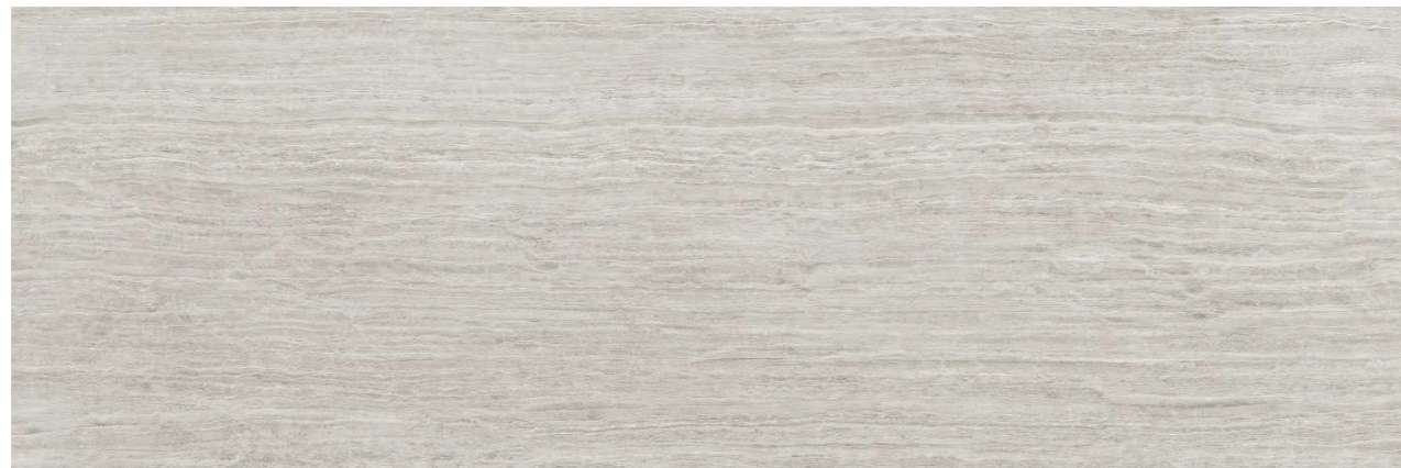
Travertino Grey 100x300 cm

En baño principal se diseña una caja para el área ducha y bañera alicatada completamente y de gran efecto visual, con porcelánico rectificado de gran formato con terminación efecto travertino.