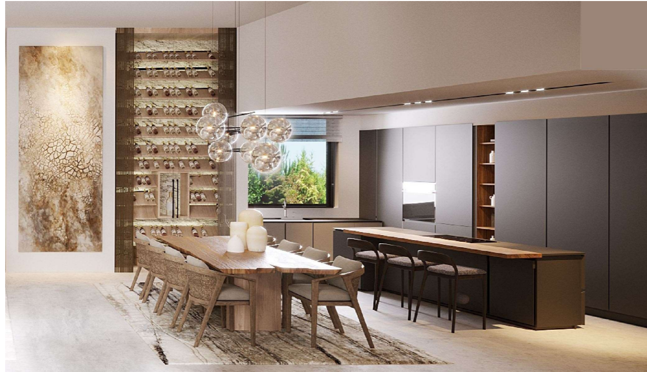
Imagen figurativa no vinculante. Propuesta de decoración opcional.

Cocina de diseño completa, de la marca Dica o similar equipada con electrodomésticos Neff . Los frentes lacados mate en color gris noche, extremadamente resistentes y muy fáciles de limpiar e higiénicos, se han combinado, con estantería y barra sobre encimera en color Olmo Natur.