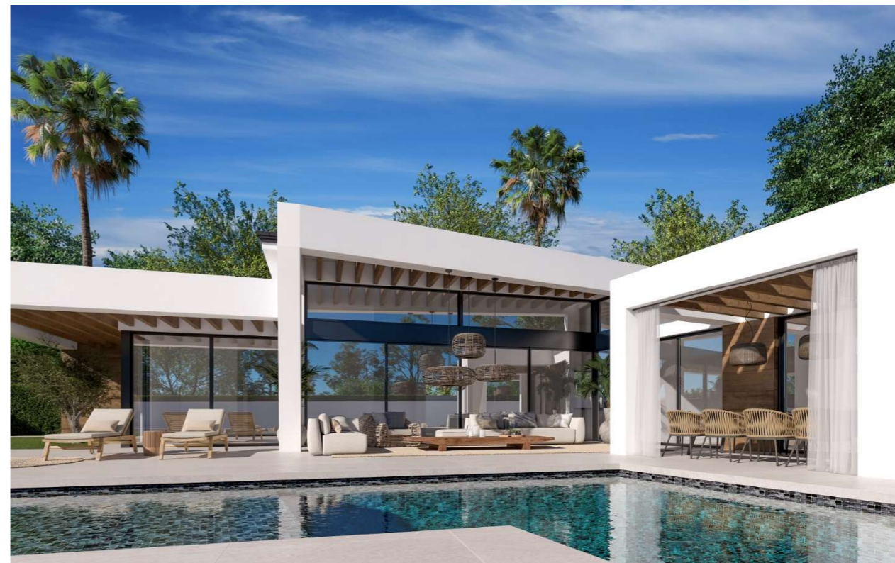
Imagen figurativa no vinculante. Propuesta de decoración opcional.

En dormitorio master vestidor con iluminación led y distribución, y armarios empotrados con puertas suelo techo en el resto dormitorios, vestidos interiormente con distribución funcional de baldas separadoras, barras de colgar y cómoda con cajones.