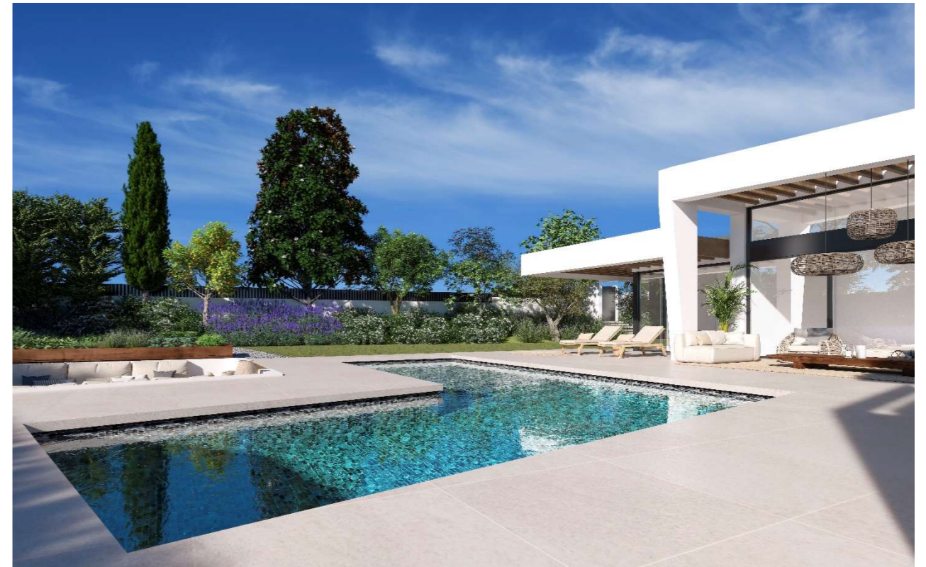
Imagen figurativa no vinculante. Propuesta de decoración opcional.