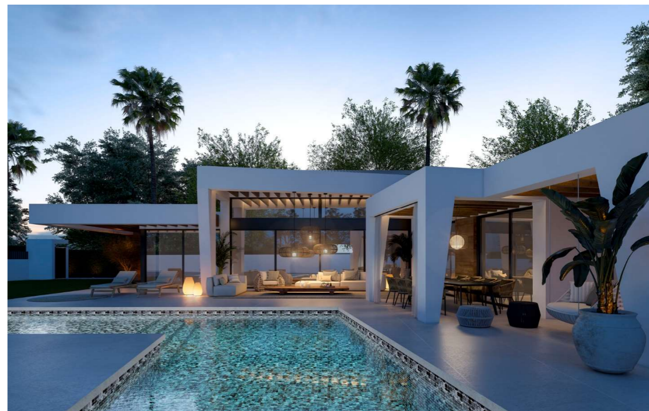
Imagen figurativa no vinculante. Propuesta de decoración opcional.