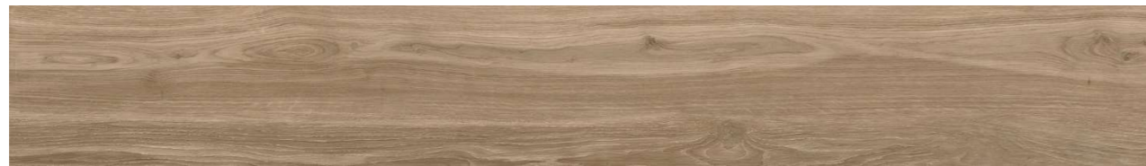
Origin Umber 22,5 x 180 cm

En dormitorios, tanto principal como secundarios, se dispondrá en gres porcelánico rectificado con terminación efecto madera Origin Umber 22,5 x 180 cm según imagen adjunta.