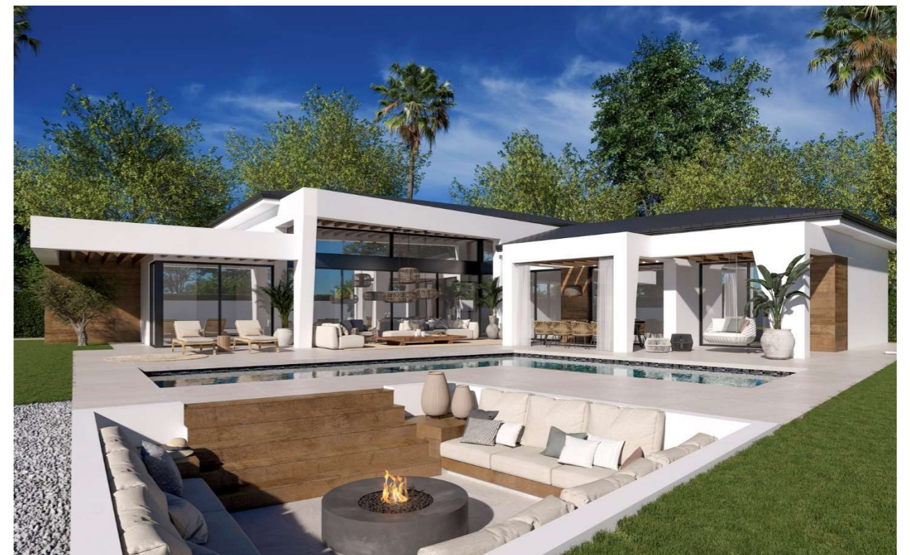
Imagen figurativa no vinculante. Propuesta de decoración opcional.