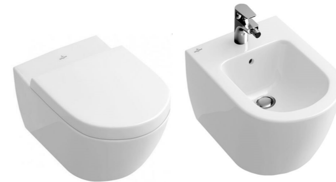
Grifería figurativa no vinculante.

Inodoro suspendido con cisterna empotrada en cerramiento con pulsador de descarga media y completa, asiento y tapa amortiguados. Villeroy Boch modelo SUBWAY 2.0, en todos los baños y aseo. Bidé del mismo modelo en baño master.