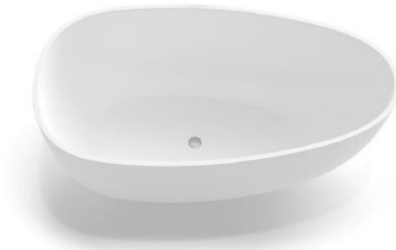
Grifería figurativa no vinculante.

Bañera exenta de 170 x 88 cm con grifo a suelo.